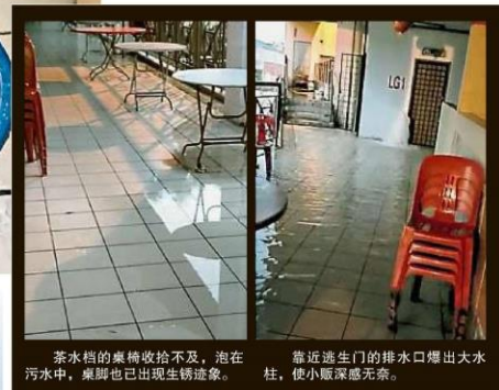
茶水档的桌椅收拾不及,泡在污水中,桌椅也已出现生锈迹象。靠近逃生门的排水口爆出水柱,使小贩深感无奈。