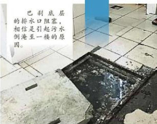
巴刹底层的排水口阻塞,相信是引起污水倒灌至一楼的原因。