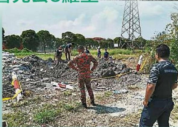
蘇丹蘇萊曼鎮的蘇丹莫哈末1路也被列為其中一個非法垃圾場“熱點”。

較早前，巴生武吉惹惹瓦嘉路就出現一座巨型的“垃圾山”，所堆積的垃圾多達3000噸，估計都是由一些工廠或私人承包商日夜累積丟棄所致。