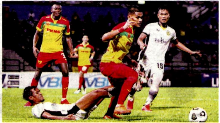
SELANGOR beraksi cemerlang dengan menewaskan Perak dalam saingan Liga Super.

"Kami akan bertemu Kedah dalam saingan akan datang di tempat sendiri. Kita mahu bangkit dan memberi saingan dalam liga nanti," katanya.