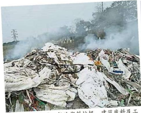
垃圾堆內的一般為塑料垃圾、建築廢料及工業廢料，也有不少住家垃圾。