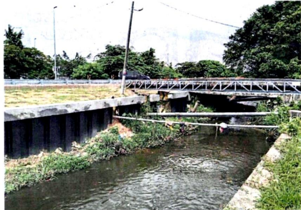
■河流小桥下方的水管，在河水高涨时，会阻碍正常排水。