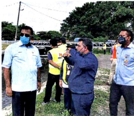
■古纳拉兹（左）与相关单位的官员，一起视察水管带来的问题。