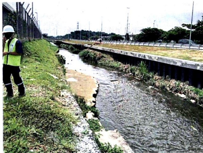
■上游地区的排水量，都会经过这条小河，因此该河必须通畅无阻。

他说，有时候垃圾还会“卡”在水管表面，进一步加剧影响排水，导致上游地区因此经常一雨成灾。